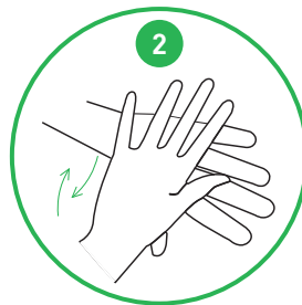
2 Gnid handryggarna mot varandra