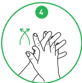
4 Gnid mellan fingrarna