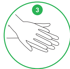
3 Gnid handflatan mot den andra handens handrygg